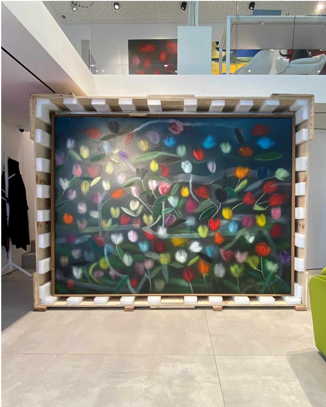
Ross Bleckner Prince/Frog , 2023 Olje na lanenem platnu 183 x 244 cm (72 x 96.1 inches)