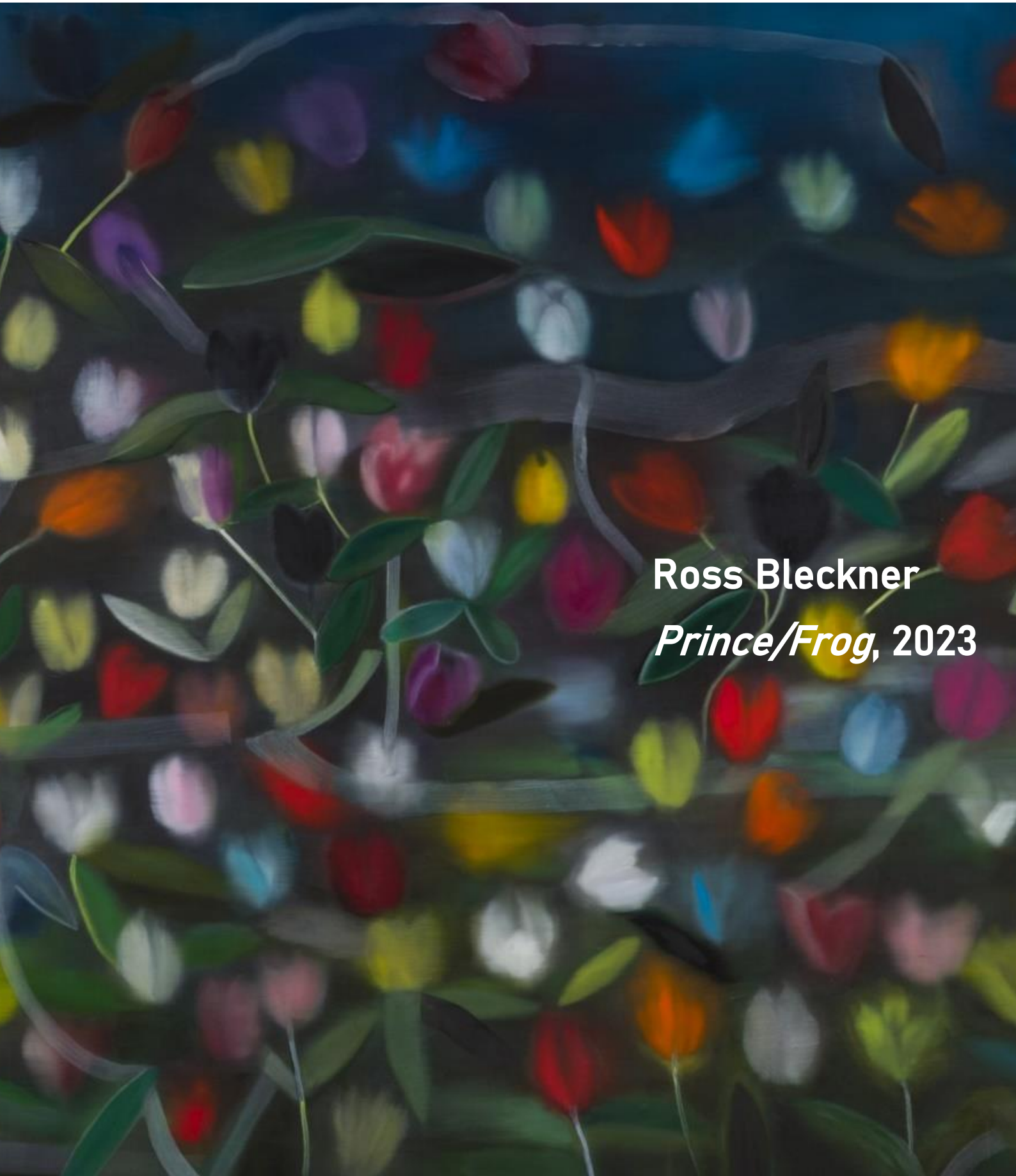
Ross Bleckner Prince/Frog, 2023