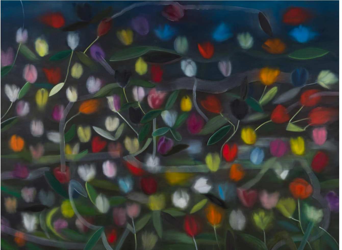
Ross Bleckner Prince/Frog , 2023 Olje na lanenem platnu 183 x 244 cm (72 x 96.1 inches)