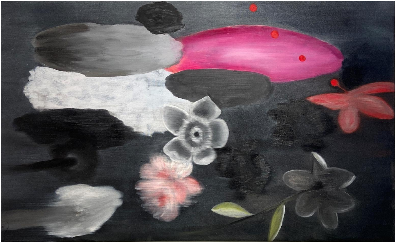
Ross Bleckner Brez naslova , 2023 Olje na lanenem platnu 68 x 140 cm (26.8 x 55.1 inches)