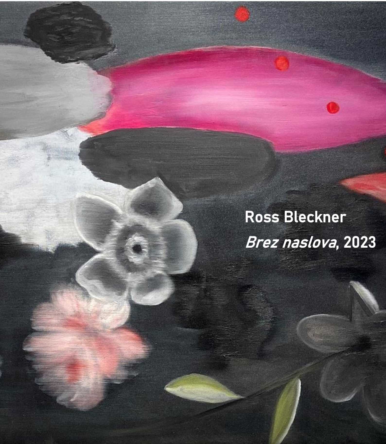
Ross Bleckner Brez naslova, 2023