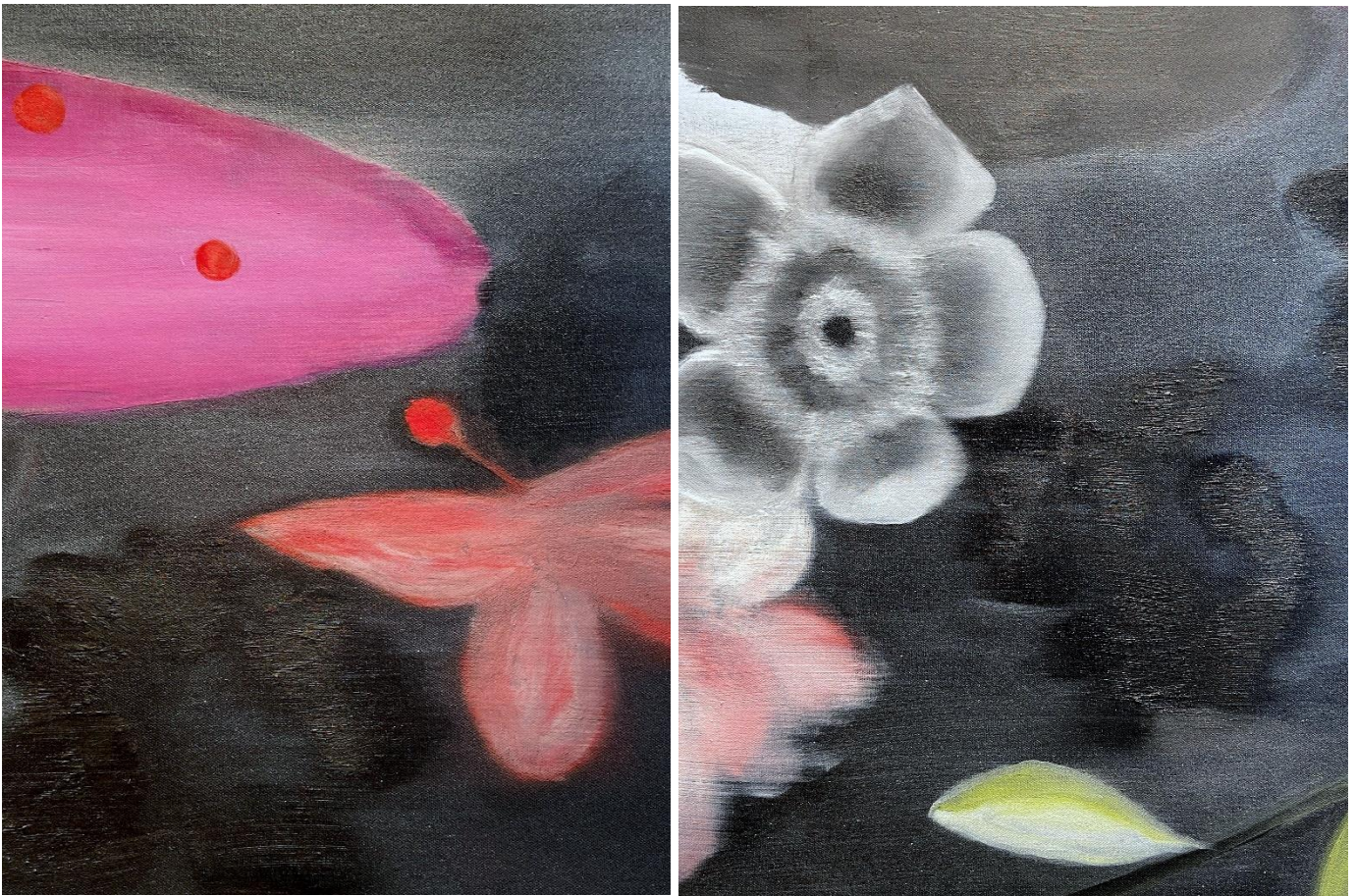
Ross Bleckner Brez naslova (detajli), 2023 Olje na lanenem platnu 68 x 140 cm (26.8 x 55.1 inches)