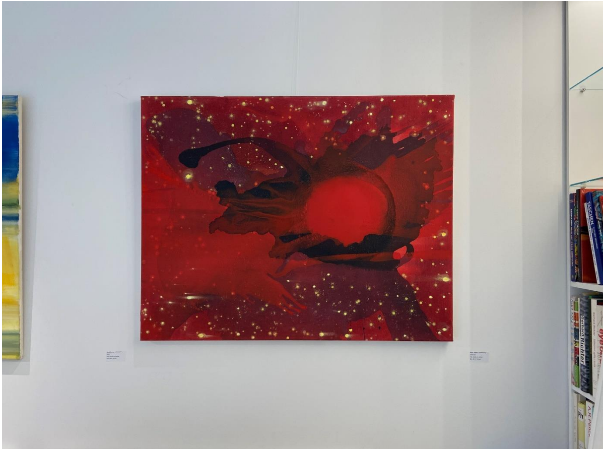
Bernd Zimmer »Erscheinung« , 2005/2007 Akрил na platno 84 x 104 cm (33.1 x 40.9 inches)