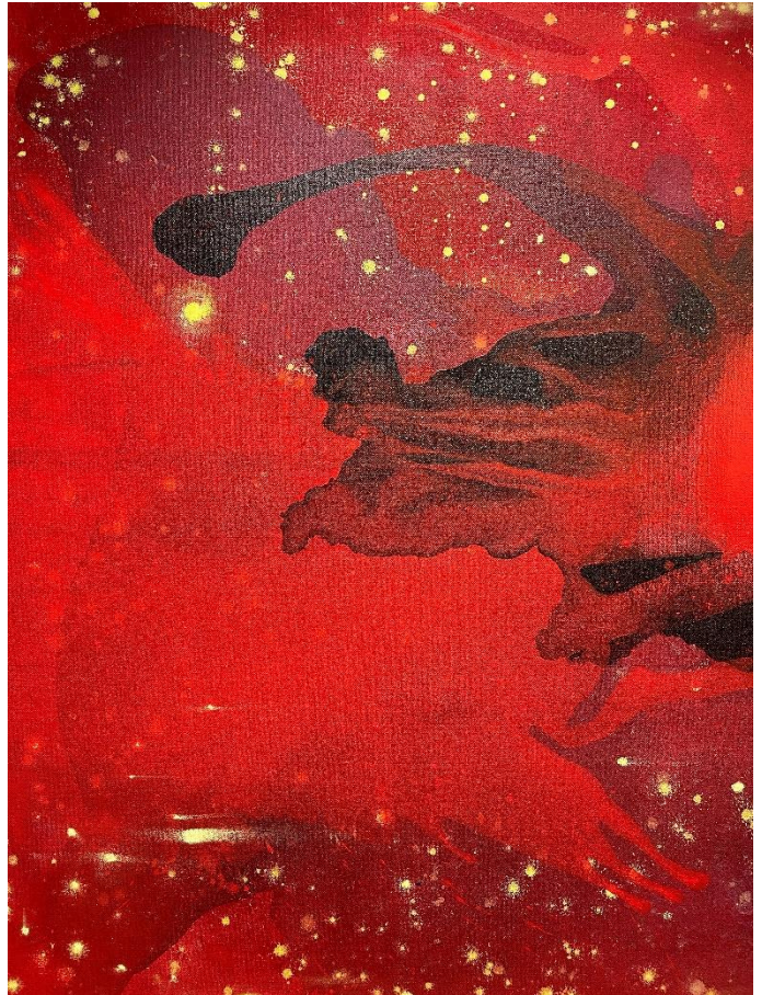
Bernd Zimmer »Erscheinung«, (detajli), 2005/2007 Akрил na platno 84 x 104 cm (33.1 x 40.9 inches)