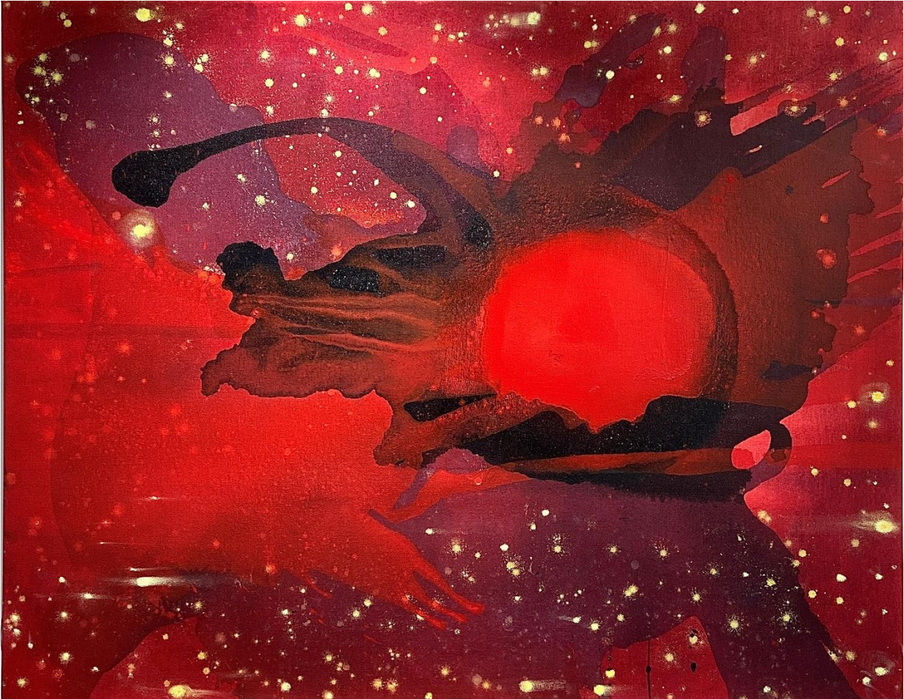
Bernd Zimmer »Erscheinung« , 2005/2007 Akryl na platno 84 x 104 cm (33.1 x 40.9 inches)