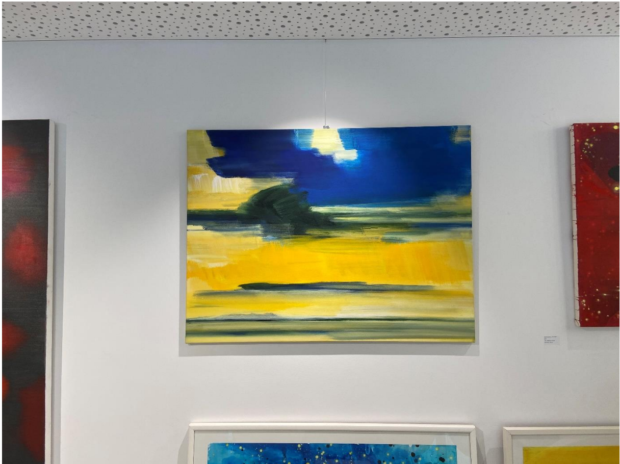
Bernd Zimmer Himmel III , 2004 Akрил na platno 90 x 120 cm (35.4 x 47.2 inches)