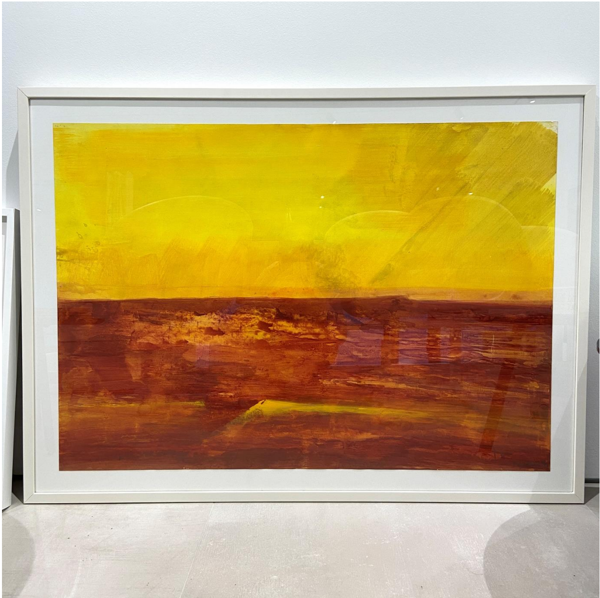
Bernd Zimmer Sandsee, 2000 Akрил in olje na papirju 70 x 100 cm (27.5 x 39.4 inches)