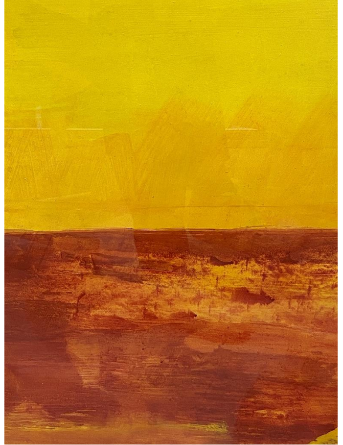
Bernd Zimmer Sandsee (detajli), 2000 Akril in olje na papirju 70 x 100 cm (27.5 x 39.4 inches)