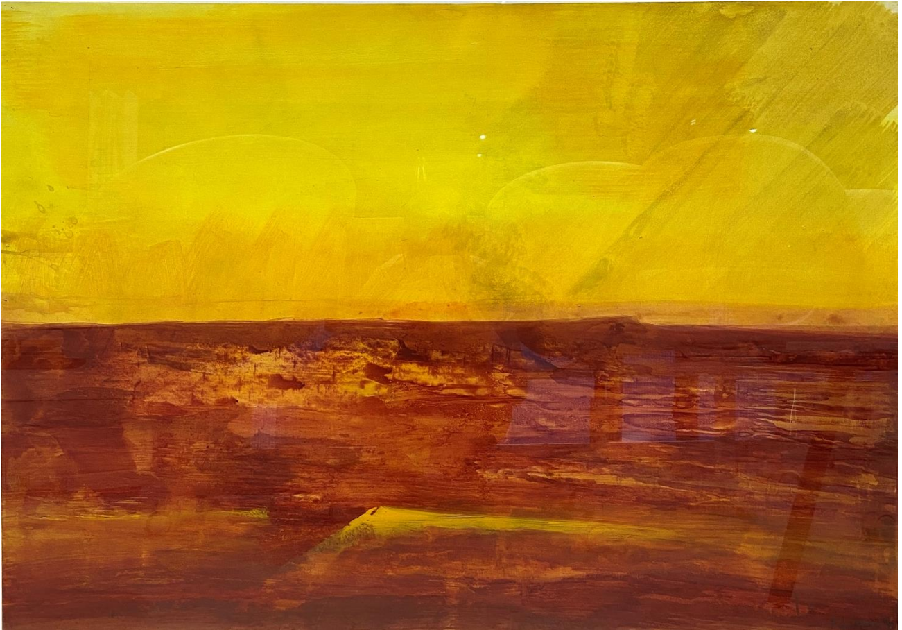
Bernd Zimmer Sandsee , 2000 Akрил in olje na papirju 70 x 100 cm (27.5 x 39.4 inches)