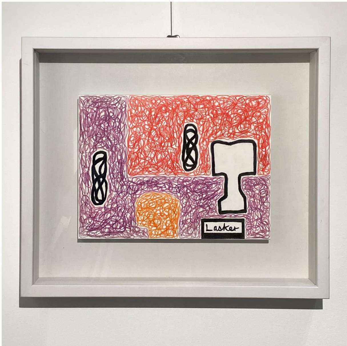
Jonathan Lasker Brez naslova , 2016 Barvica in oglje na papir cca. 24 x 35 cm (9.4 x 13.8 inches)