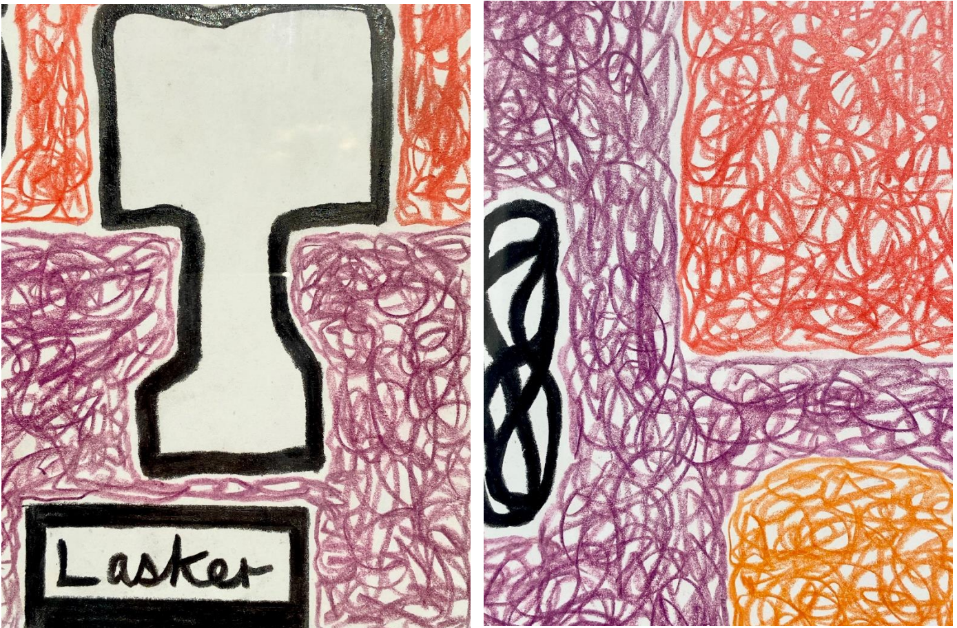
Jonathan Lasker Brez naslova (detajli), 2016 Barvica in oglje na papir cca. 24 x 35 cm (9.4 x 13.8 inches)