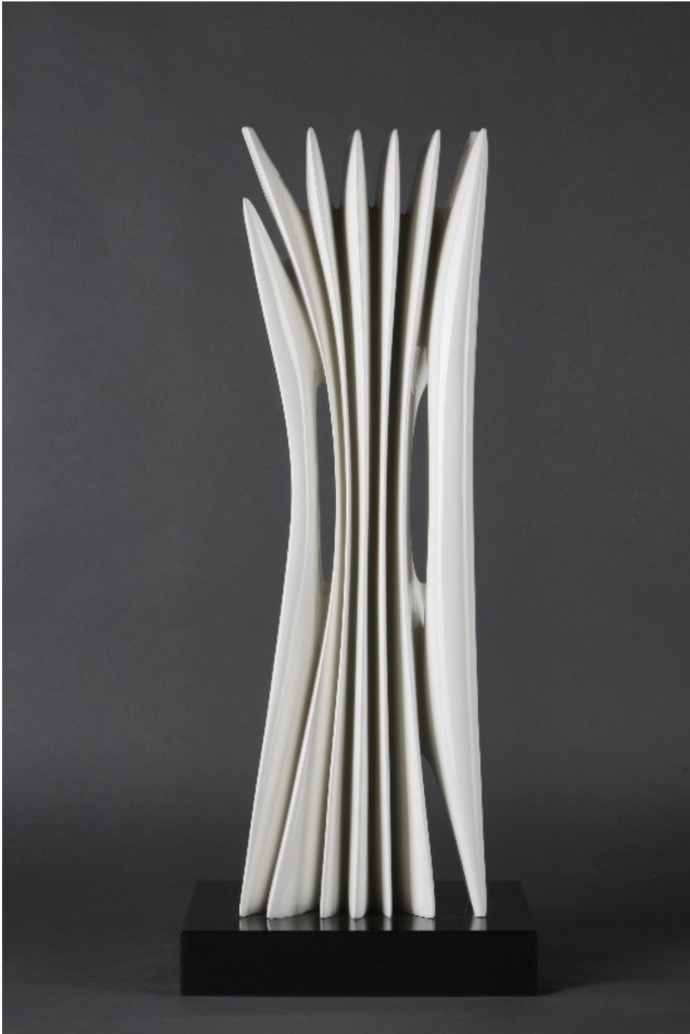
Brez naslova, 2023 Bron z avtomobilsko barvo, 73,5 x 22,5 x 15 cm