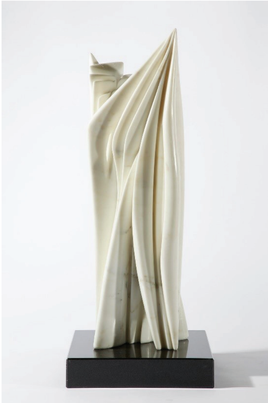
Brez naslova, 2017 Marmor, 66,5 x 20,5 x 13 cm