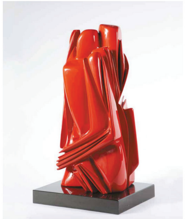
EL ABRAZO, 2017 Bronze with red automotive enamel, edition of 8 74.5 x 39.5 x 34 cm | 29.3 x 15.5 x 13.4 in Price on request