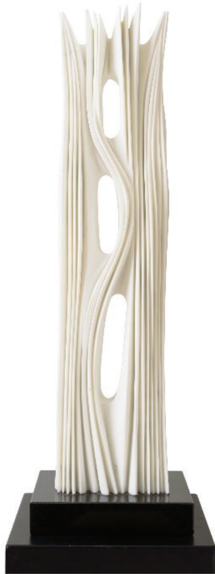
Brez naslova, 2021 Carrara marmor, 132 x 35 x 40 cm