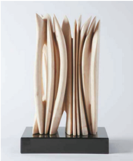
UNTITLED, 2017 Pink Portuguese marble, unique piece 46.5 x 25 x 13.5 cm | 18.3 x 9.8 x 5.3 in Price on request