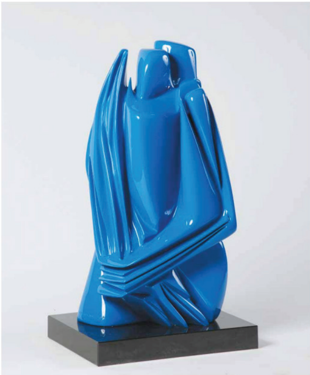
EL ABRAZO, 2017 Bronze with blue automotive enamel, edition of 8 74.5 x 39.5 x 34 cm | 29.3 x 15.5 x 13.4 in Price on request