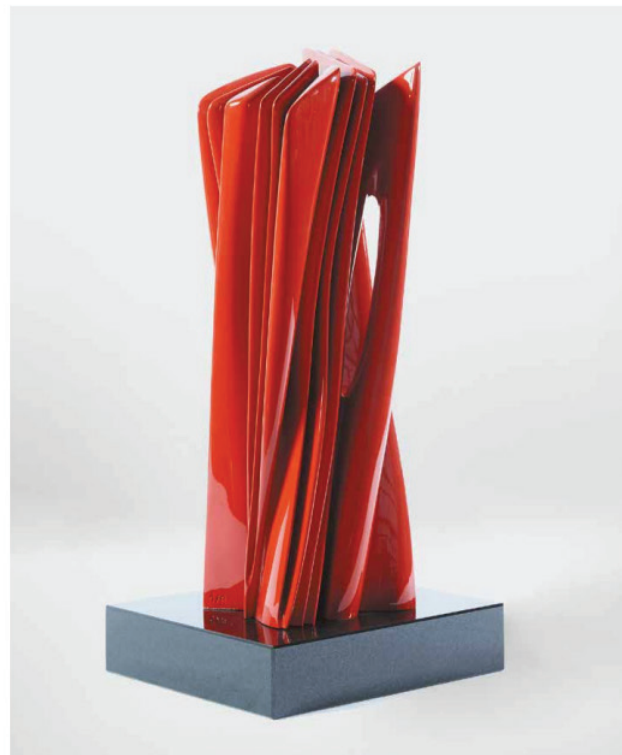
UNTITLED, 2016 Bronze with red automotive enamel, edition of 8 50x16x14cm | 19.7x6.3x5.5 in Price on request