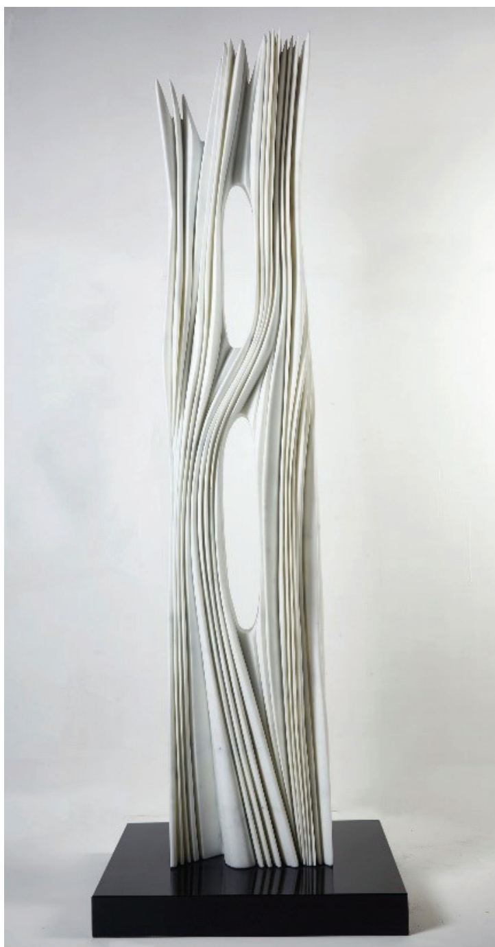
L'esprit de Paris, 2019 Carrara marmor, 220 x 43 x 27 cm