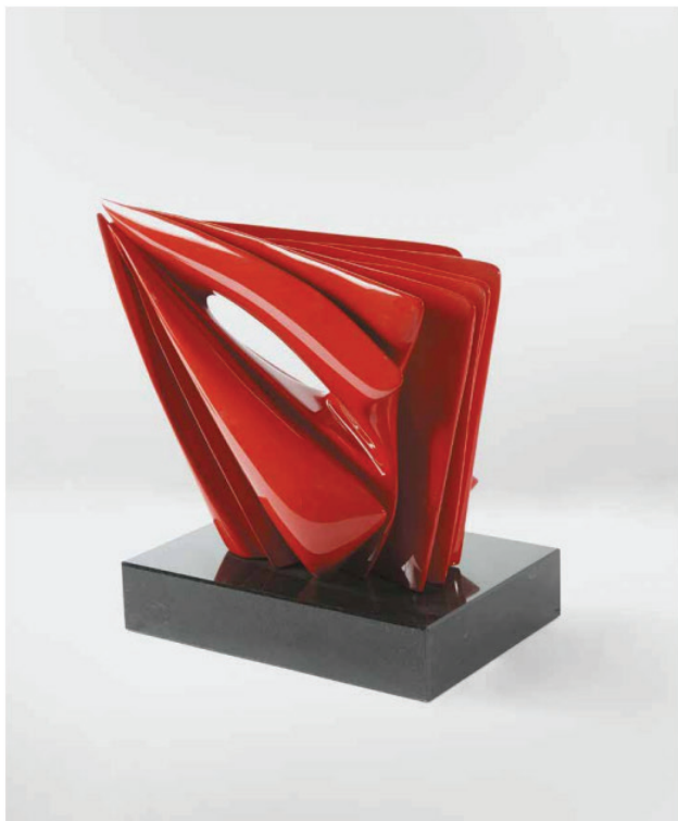
UNTITLED, 2016 Bronze with red automotive enamel, edition of 8 30x39x21cm | 11.8x15.3x8.3 in Price on request

Intervju: https://www.operagallery.com/storage/exhibitions/452.pdf