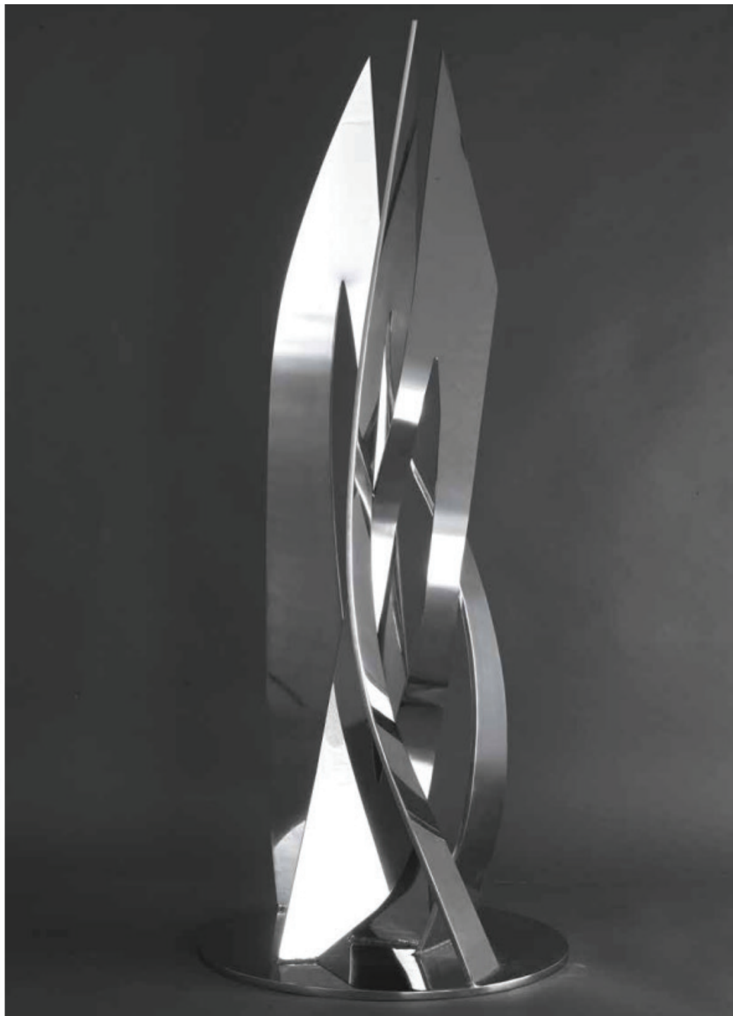
VELAS DE ORIENTE, 2016 Polished stainless steel, unique piece 122 x 48 x 30 cm | 48 x 18.9 x 11.8 in Price on request